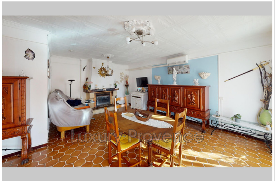
House T24098 Pourrières